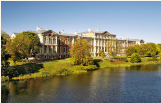
Елгавский дворец, вид со стороны моста