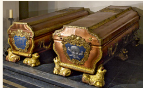
Саркофаги герцога Эрнста Иоганна и герцогини Бенигны Готтлиб

В 1820 году в юго-восточной части дворца было оборудовано более просторное помещение для усыпальницы, где она находится и сегодня. В окнах усыпальницы сохранились декоративные кованные решетки с монограммой герцога Эрнста Иоганна.