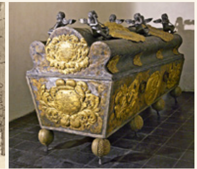
Саркофаг герцогини Софии Амелии

В усыпальнице курляндских герцогов Елгавского дворца покоятся останки 24 представителей династии Кетлеров и шести представителей династии Биронов. Первые сыновья герцога Готхарда Сигизмунд Альберт, Георг и Готхард были захоронены в гробнице Кулдигского замка и только позднее перевезены в новую усыпальницу курляндских герцогов, построенную под освященной в 1582 году церковью Елгавского дворца. Первым здесь был захоронен скончавшийся в 1587 году герцог Готхард.