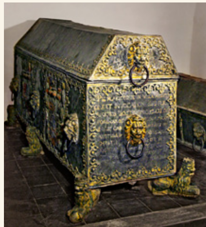
Саркофаг герцога Вильгельма

В 1737 году старая герцогская резиденция вместе с церковью были разобраны, чтобы освободить место для строительства спроектированного Ф. Б. Растрелли нового дворца. Герцогские останки были вывезены на временное хранение, а в 1740 году перенесены в два помещения цокольного этажа нового дворца.