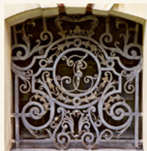
Решетка окна усыпальницы с монограммой герцога Эрнста Иоганна

В усыпальнице курляндских герцогов находятся 21 саркофаг из металла и девять деревянных гробов. Самый ранний оловянный саркофаг принадлежит