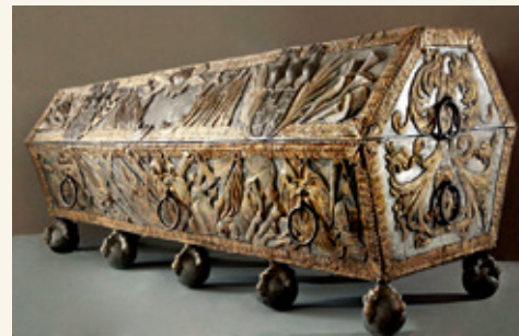
Саркофаг герцога Якоба

В 1705 году герцогская усыпальница Елгавского дворца была разграблена солдатами шведской армии, а в 1919 году пережила погромы, устроенные коммунистами и солдатами армии Бермонта-Авалова. В 1934–1935 годах саркофаги были отреставрированы, усыпальница была расширена и открыта для осмотра.