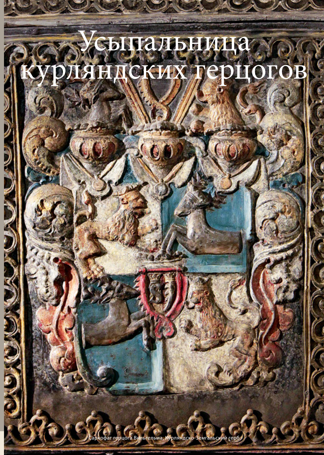
Саркофаг герцога Вильгельма, Курляндско-Земгальский герб