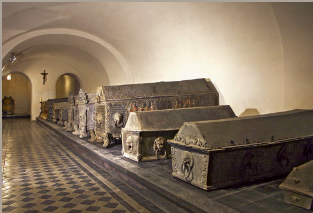
Kurzemes hercoga kapenes. 2010. gada foto