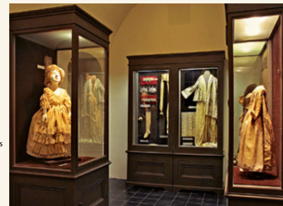
Bērnu apģērbu un tekstiliju izstāde hercogu kapenēs

Hercogu apbedījumi cieta 1705. gada septembrī, kad sarkofāgus izlaupīja zviedru kareivji, un 1919. gadā, kad kapenes demolēja komunistu un Bermonta-Avalova armijas kareivji. 1934.–1935. gadā sarkofāgus restaurēja, kapenes paplašināja un atvēra apskatei. Hercogu kapenes ilgstoši tika demolētas pēc Otrā pasaules kara. 1990. gadā Kurzemes hercogu kapenes tika atvērtas