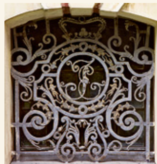
Dekoratīvas dzelzs kaluma logu restes ar hercoga Ernsta Johana monogrammu

Kurzemes hercogu kapenēs atrodas 21 metāla sarkofāgs un deviņi koka zārki. Senākais alvas sarkofāgs pieder 1569. gadā mirušajam hercoga Gotharda