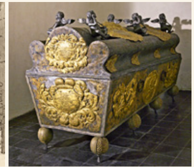
Hercogienes Sofijas Amēlijas sarkofāgs

Kurzemes hercogu kapenēs Jelgavas pili apglabāti 24 Ketleru un seši Bironu dinastijas locekļi. Pirmie mirušie hercoga Gotharda dēli Sigismunds Alberts, Georgs un Gothards tika apbedīti Kuldīgas pili un tikai vēlāk pārvesti uz jaunajām Kurzemes hercogu kapenēm, kas izbūvētas zem 1582. gadā iesvētītās Jelgavas pils baznīcas. Tajās kā pirmais guldīts 1587. gadā mirušais hercogs Gothards.