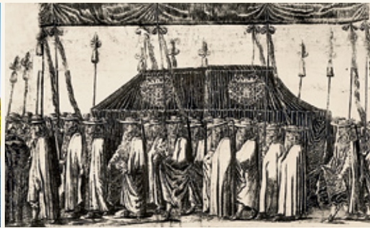
Kurzemes hercogienes Luīzes Šarlotes bērnu gājiens