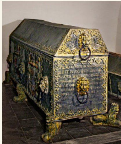
Hercoga Vilhelma sarkofāgs

1737. gadā, kad baznīcu līdz ar seno hercogu rezidenci nojauca, lai atbrīvotu vietu jaunajai F. B. Rastrelli celtajai pili, apbedījumus novietoja noliktavā, bet 1740. gadā tie pārnesti uz divām telpām jaunās pils cokola stāvā. 1820. gadā izbūvēja plašāku kapeņu telpu pils dienvidaustrumu stūrī, kur tās atrodas joprojām. Kapeņu logus sedz dekoratīvas dzelzs kaluma restes ar hercoga Ernsta Johana monogrammu.