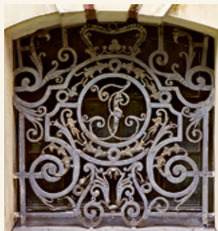
Dekoratīvas dzelzs kaluma logu restes ar hercoga Ernsta Johana monogrammu

Kurzemes hercogu kapenēs atrodas 21 metāla sarkofāgs un deviņi koka zārki. Senākais alvas sarkofāgs pieder 1569. gadā mirušajam hercoga Gotharda