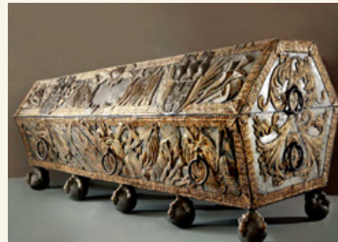
Hercoga Jēkaba sarkofāgs