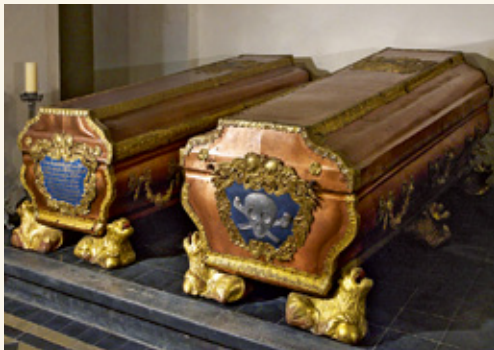
Hercoga Ernsta Johana un hercogienes Benignas Gotlības sarkofāgi

Kapenēs izstādīti arī apģērbi un tekstiliju paraugi no hercogu un viņu ģimenes locekļu apbedījumiem.