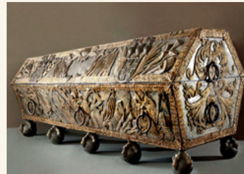
Hercoga Jēkaba sarkofāgs