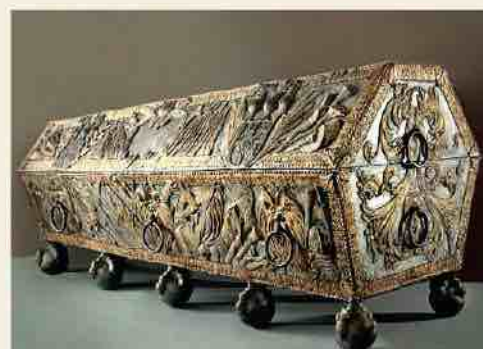
Hertsog Jacobi sarkofaag