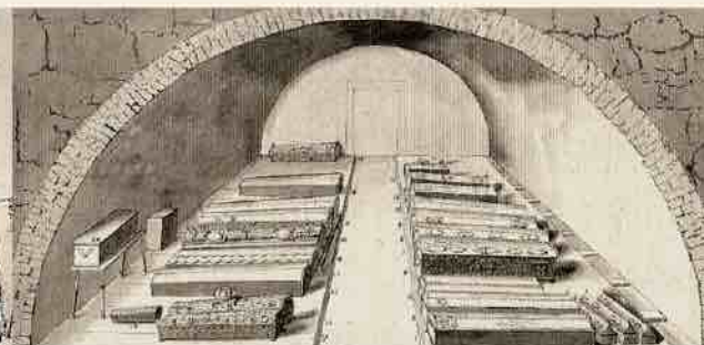
Kuramaa hertsogite hauakamber vanas lossis. 1730. aastad