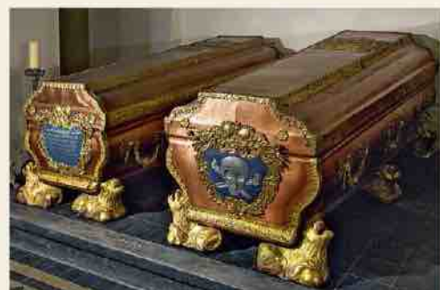
Hertsog Ernst Johanni ja hertsoginna Benigna Gottliebe sarkofaagid

1737. aastal lammutati kirik koos hertsogite vana residentsiga maha, et teha ruumi Francesco Rastrelli projekteeritud uuele lossile. Maetuid hoiti kuuris kuni 1740. aastani, mil valmisiid kaks ruumi uue lossi soklikorrusel. 1820. aastal valmis hauakambri jaoks suurem ruum lossi kagunurgas, kus see asub senini. Hauakambri aknaid katavad dekoratiivsed rauast sepietatud restid hertsog Ernst Johanni monogrammiga.