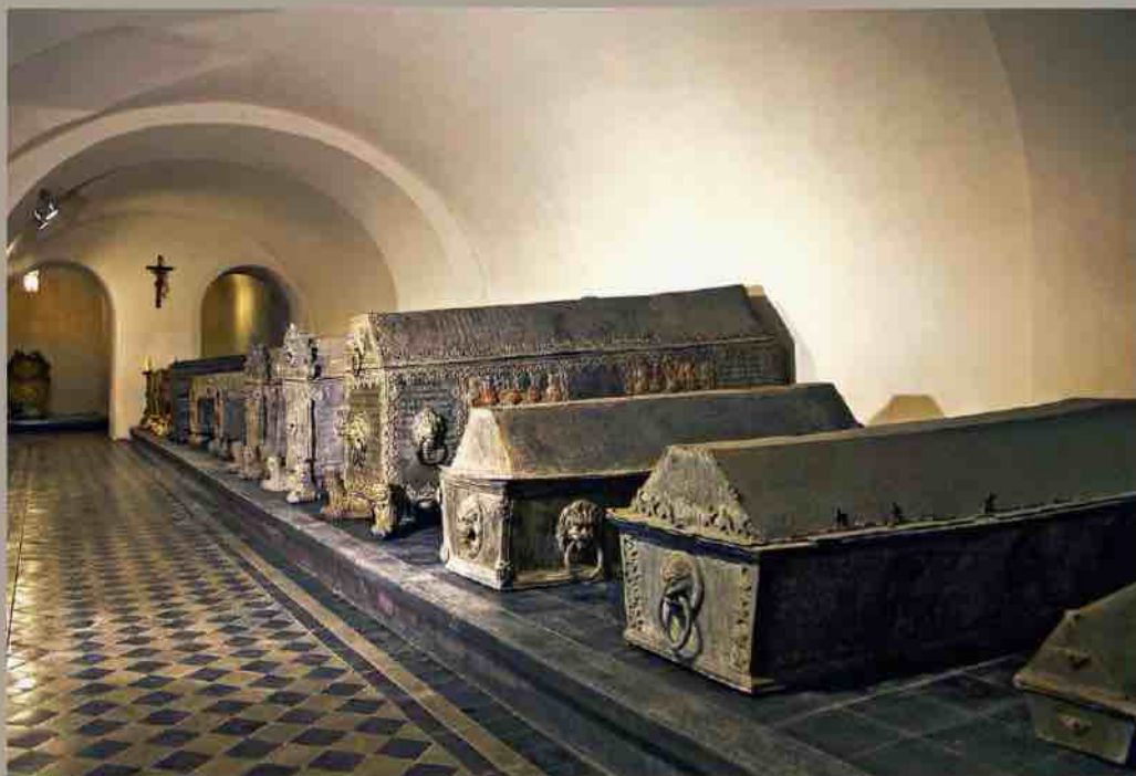
Kuramaa hertsogite hauakamber.