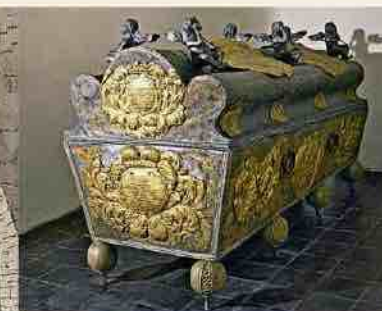
Hertsoginna Sophie Amalie sarkofaag

Kuramaa hertsogite hauakamber Jelgava lossis on suurim selletaoline matmispaik Lätis, sealjuures üks vähestest valitsejate dünastiade matmispaikadest maailmas, mida saab külastada. Sellesse on maetud 24 Kettlerite dünastia ja 6 Bironite dünastia esindajat. Algselt ehitati hauakamber 1582. aastal sisse õnnistatud Jelgava lossi kiriku alla. Esimesena maeti sinna hertsog Gotthard (†1587), seejärel aga tema kolm varem surnud poega, kes olid eelnevalt maetud Kuldiga lossi.