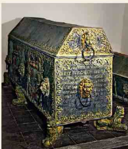
Hertsog Wilhelmi sarkofaag

Kuramaa hertsogite hauakamber Jelgava lossis on suurim selletaoline matmispaik Lätis, sealjuures üks vähestest valitsejate dünastiade matmispaikadest maailmas, mida saab külastada. Sellesse on maetud 24 Kettlerite dünastia ja 6 Bironite dünastia esindajat. Algselt ehitati hauakamber 1582. aastal sisse õnnistatud Jelgava lossi kiriku alla. Esimesena maeti sinna hertsog Gotthard (†1587), seejärel aga tema kolm varem surnud poega, kes olid eelnevalt maetud Kuldiga lossi.