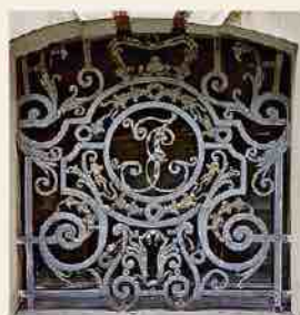
Dekoratiivsed rauast sepietatud restid hertsog Ernst Johanni monogrammiga

Sajandite jooksul on hertsogite haudu mitmeid kordi armutult lõhutud ja rüüstatud. 1705. aastal rüüstasid sarkofaage rootsi sõdurid, 1919. aastal lõhkusid hauakambrit nii bolševike kui Bermond-Avalovi vägede soldatid. Läti vabariigi ajal restaureeriti sarkofaagid, remonditi ja laiendati hauakambrit ning 1935. aastal avati see külastajatele. Pärast II maailmasõda rüüstati ja rüvetati hauakambrit pikka aega.