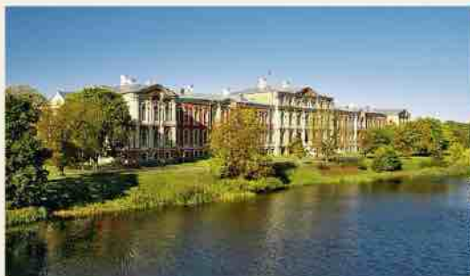
Jelgava loss, vaade sillalt