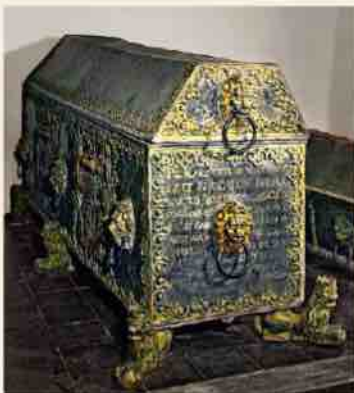
Sarcophage du duc Guillaume

Cette église de même que l'ancienne résidence des ducs fut détruite en 1737 pour libérer de la place