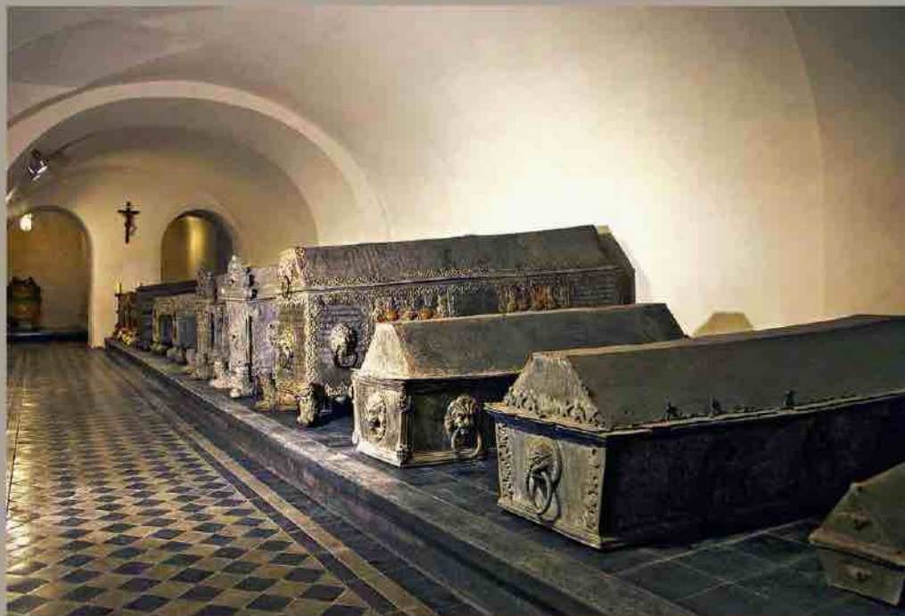
Tombeaux des ducs de Courlande