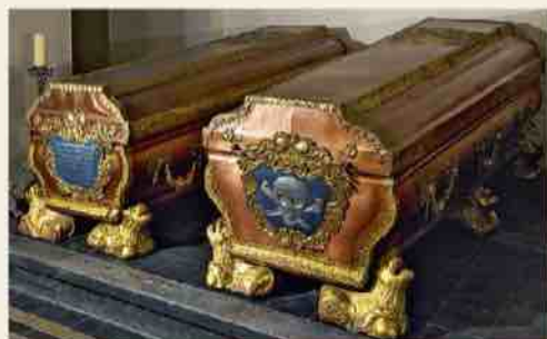
Sarcophages du duc Ernst Johann et de la duchesse Benigna Gottlieb

Dans la salle contiguë aux tombeaux sont exposés des vêtements d'enterrement restaurés, des fragments de pièces de textile et autres témoignages historiques.