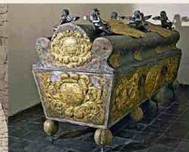
Sarcophage de la duchesse Sophie-Amélie

Les tombeaux des ducs de Courlande, au château de Jelgava, qui est le plus important lieu d'enterrement de ce type en Lettonie et aussi l'un des rares lieux d'enterrement au monde de la dynastie des gouverneurs, sont accessibles aux visiteurs. 24 représentants de la dynastie Kettler et 6 de la famille Biron y reposent. Initialement une crypte fut édifiée au-dessous de l'église de Jelgava inaugurée en 1582. Le duc Gotthard (†1587) y fut enterré le premier, puis trois de ses fils morts avant lui enterrés à l'origine au château de Kuldīga.