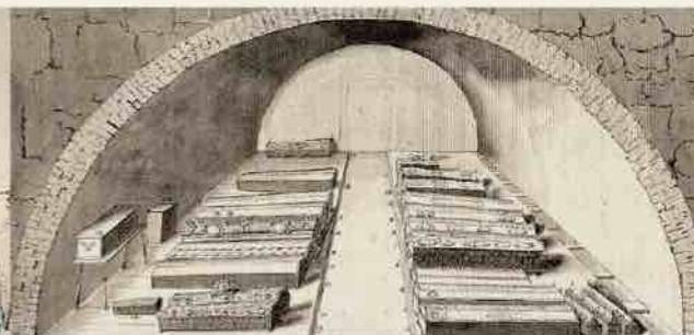
Tombeaux des ducs de Courlande dans le vieux château. Années 1730