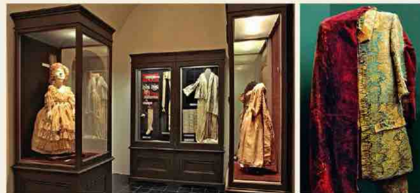
Vêtements restaurés présentés à l'exposition permanente du musée

Au cours des siècles, les sépultures des ducs furent à plusieurs reprises violemment dévastées et cambriolées. En 1705 les sarcophages furent volés par les soldats suédois, et en 1919 les tombeaux subirent les démolitions par les soldats bolcheviks et l'armée Bermond-Avalov. Lors de la première République de