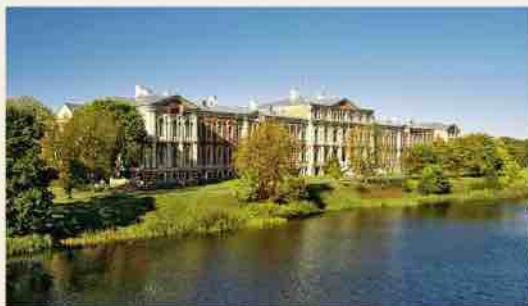
Château de Jelgava, vue depuis le pont