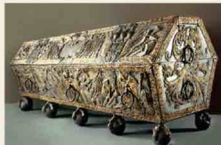
Sarcophage du duc Jacob