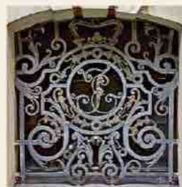
Grille de fenêtre des tombeaux avec le monogramme du duc Ernst Johann

Depuis 1987 les tombeaux des ducs de Courlande sont sous tutelle du musée du château de Rundāle. Dès 1990 ils sont de nouveau accessibles au public. Compte tenu de leur valeur historique et artistique, un musée y est aménagé dont l'objectif est la conservation générale et l'entretien des tombes en tenant compte du processus naturel de disparition. La conservation et la restauration des tombes, des sarcophages et des pièces de textile, l'entretien et la préservation des sépultures se fait sans toucher au sens même de ce lieu de repos.