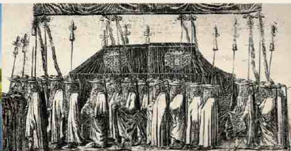
Cortège funèbre de la duchesse Louise Charlotte