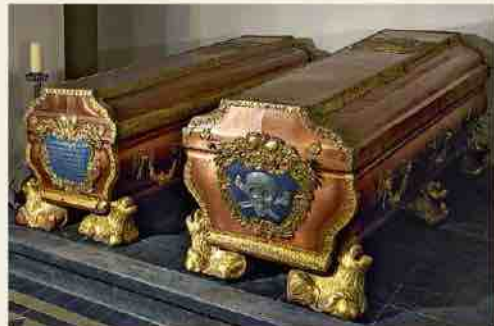
Hercogo Ernsto Johano ir hercogienēs Benignos Gotlybos sarkofagai

Kuršo hercogu kriptā Jelgavas rūmuosē yā didžiausia tokio tipo laidojimo vieta Latvijojē, be to, viena iš ne- daugelio valdovū dinastijū laidojimo vietū pasaulyē, pasiekiamo lankytojams. Joje palaidoti 24 Ketleriū dinastijos bei 6 Bironū dinastijos atstovai. Iš pradziū kriptā buvo įrengta po 1582 m. pašventinta Jelgavas rūmū bažnyčia. Pirmasis joje buvo palaidotas hercogas Gothardas (†1587), tada – trys jo anksčiau mirę sūnūs, prieš tai palaidoti Kuldygos pilijē.