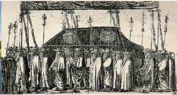
Hercogienės Luīzoz Šarlotēs laidotuvu tēisena