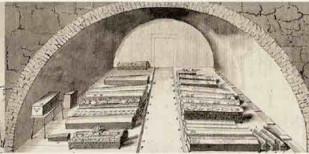
Kuršo hercogu kriptā senojoje pilijē. XVIII a. 4-asis dešimtmetis