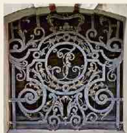
Dekoratyvinės kaltos geležies lango grotos

Nuo 1987 m. Kuršo hercogu kriptā pateko Rundalės rūmū muziejaus žinion, 1990 m. ji atidaryta lankytojams. Atsižvelgiant į istorinę ir meninę kriptos vertę joje įrengtas muziejus, kurio uždavinys – visavertis rūpestis objektu ir jo saugojimas nuo natūralaus nykimo procesū. Nedrumščiant šios vietos ramybės vyksta karstū, sarkofagū, tekstilės dirbinių konservavimo ir restauravimo, palaikū tvarkymo ir išsaugojimo darbai.