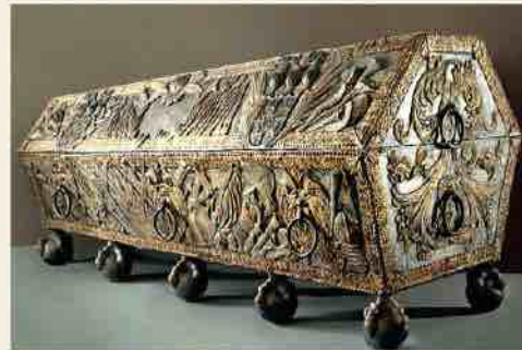
Hercogo Jakobo sarkofagas