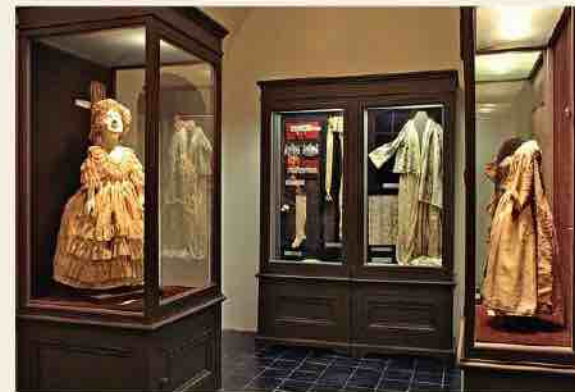
Hercogo Frydricho Kazimiro liemenė ir mantijos fragmentas