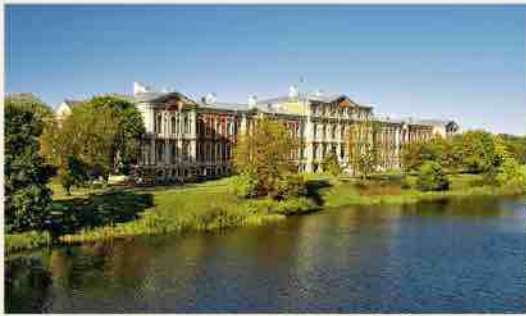
Jelgavas rūmai, vaizdas nuo tilto