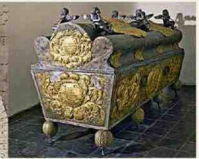
Hercogienēs Sofijas Amelijos sarkofags

Kuršo hercogu kriptā Jelgavas rūmuosē yā didžiausia tokio tipo laidojimo vieta Latvijojē, be to, viena iš ne- daugelio valdovū dinastijū laidojimo vietū pasaulyē, pasiekiamo lankytojams. Joje palaidoti 24 Ketleriū dinastijos bei 6 Bironū dinastijos atstovai. Iš pradziū kriptā buvo įrengta po 1582 m. pašventinta Jelgavas rūmū bažnyčia. Pirmasis joje buvo palaidotas hercogas Gothardas (†1587), tada – trys jo anksčiau mirę sūnūs, prieš tai palaidoti Kuldygos pilijē.