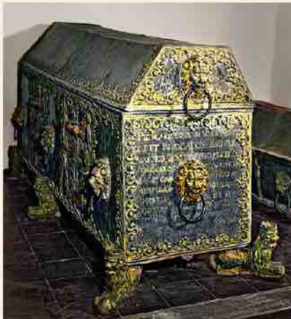
Hercogo Vilhelmo sarkofagas

Bėgant amžiams hercogu kriptos keletą kartū buvo negailestingai nuniokotos ir apiplėštos. 1705 m. sarkofagus išplėšė švedū kareiviai, 1919 m. kriptą nusiaubė tiek bolševikū, tiek Bermonto-Avalovo armijū kareiviai. Nepriklausomos prieškario Latvijos metais sarkofagai restauruoti, kriptā suremontuota ir paplatinginta, 1935 m. ji tapo prieinama apžiūrai. Po Antrojo