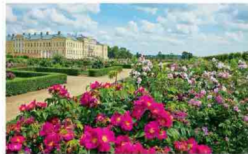
Ajalooliste rooside sektor

Ajaloolised roosid õitsevad enamasti vaid ühe korra: mai lõpust juuli keskpaigani, aga tänapäeva roosid õitsevad korduvalt kuni öökülmadeni. Erinevad roosi-