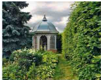
Pavillon de l'aire de Pique-nique