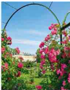
Arcades de rosiers grimpants