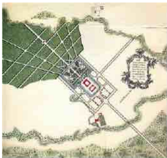
F. Rastrelli. Plan du château de Rundāle. 1735/36