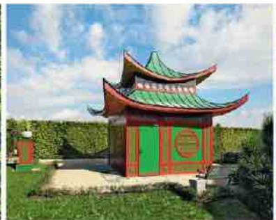
Pavillon du bosquet Oriental