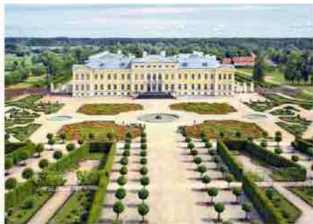
Jardin baroque du château de Rundāle