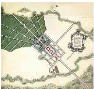
F. Rastrellis. Rundalē rūmų plans. 1735–1736 m.