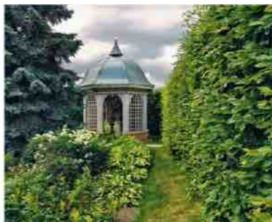
Paviljonas iķskylju aikštējē

Rastrellio projektē bosketuose pažymēti poīlsio paviljonai. Pīrmasis iķ jū pagā Feitshiochheimo ( Veitshöch-