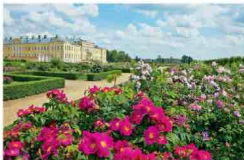
Senovīnju rozju skypelis

Abipus ornamentīno parterio puoselējamas rožynas (2) uzīma mażdaug vieno hektaro plotā. Artīmesnīuose skypeliuose auga angļīķos rožēs, prīmenančīs senovīnēs rožēs. Šiuolaikīnēs rožēs skypeliuose sugrupuotas pagā spalvas: vakarinējē pusējē auga balītas, rožīnēs ir raudonās, o rytīnējē – gelītonās, oranžīnēs bei žvīesju pastelīnīju atspalvju rožēs. Atokīausiojē sodo dalyjē po trīs skypelius kiekvienojē pusējē skīrta senovīnēmīs ir laukīnēmīs rožēmīs, naudojamoms selekcīonaujē šiuolaikīnēs rožēs.