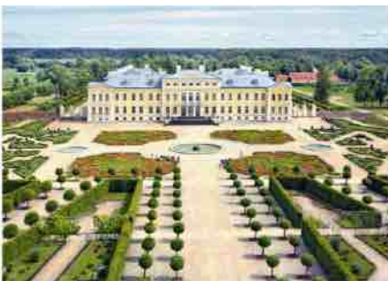
Rundalē rūmų baroko stilaus sodas