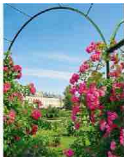
Vijoklinių rožių arkada