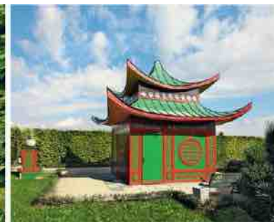
Paviljonas Rytju bosketē