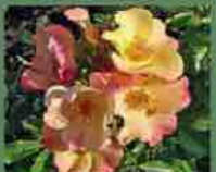
Éclat de rire 2007 F. Dorieux