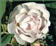
Jeanne d'Arc 1818 J. P. Vibert