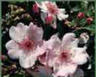
Sweet Pratty 2006 A. Meiland