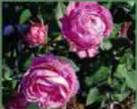
Prince Napoléon 1864 J. Pernet