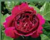
Baron Girod de l'Ain 1897 Reverchon