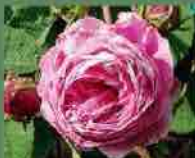
Rose des Peintres 1597