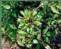
Rosa chinensis viridiflora 1827