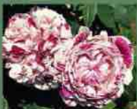
Variegata di Bologna 1909 M. Ledl