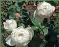
William and Catherine 2011