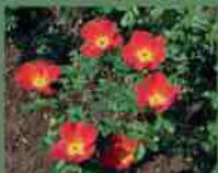
Rosa Foetida bicolor 1590