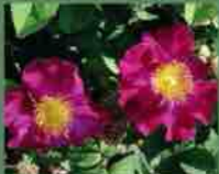
Rosa Gallica violacea 1795