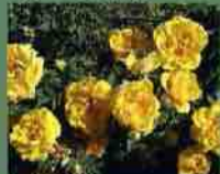
Persian Yellow 1837