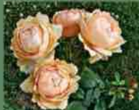
Wollerton Old Hall 2011 D. C. H. Austin