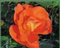
Eleanor Masson 2010 Cocker