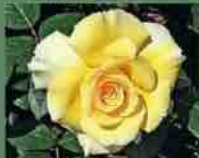
Grosvenor House 2009 A. Beales