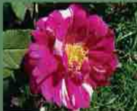
Rosa Mundi 1581