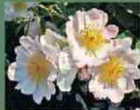
Rosa x waitziana