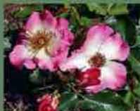
Dolomiti 2011 W. Kordes S