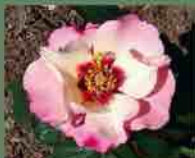
Alissar Princess of Phoenicia 2009 Harkness