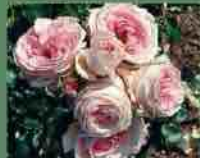
Giardina 2008 Rosen Tantau