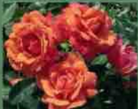
Lady Marmalade 2013 P. Harkness