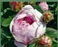
Duchesse de Montebello 1824 J. Laffay