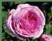
Belle sans flatterie 1820 J. F. Godefroy