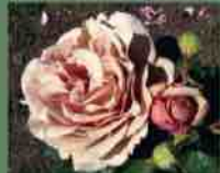
Mocarosa 2014 G. Fryer