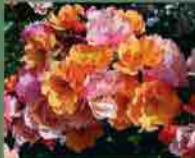
Jazz 2009 Rosen Tantau