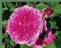
Prolifera de Redouté 1759