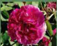
Duc de Cambridge 1840 J. Laffay