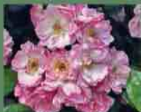
De Candolle 1590