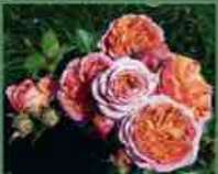
Mary Ann 2012 Rosen Tantau