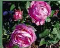
Prince Napoléon 1864 J. Pernet