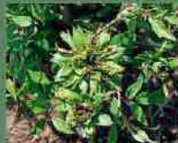
Rosa chinensis viridiflora 1827