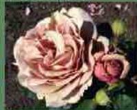
Mocarosa 2014 G. Fryer