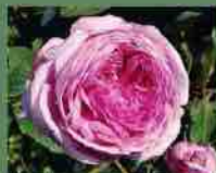
Bella sans flatterie 1820 J. F. Godefroy