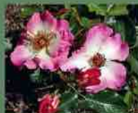
Dolomiti 2011 W. Kordes S.