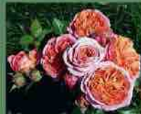
Mary Ann 2012 Rosen Tantau