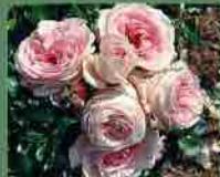
Giardina 2008 Rosen Tantau