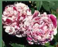
Variegata di Bologna 1909 M. Lodi