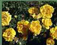
Persian Yellow 1837