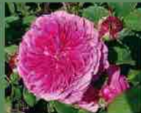
Prolifera de Redoute 1759