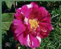
Rosa Mundi 1581