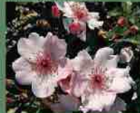
Sweet Pretty 2006 A. Meiland