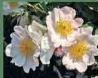
Rosa x waitziana