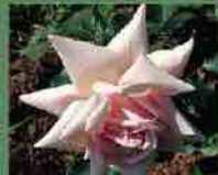
Mme Edmond Rostand 1912 J. Pernet-Ducher