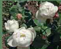
William and Catherine 2011