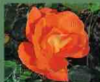
Eleanor Masson 2010 Cocker