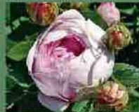
Duchesse de Montebello 1824 J. Laffay