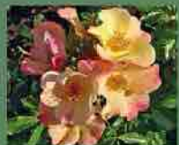
Éclat de rire 2007 F. Dorieux