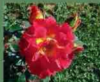
Bright and Breezy 2011 C. Dickson