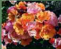
Jazz 2009 Rosen Tantau