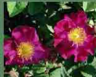
Rosa Gallica violacea 1825