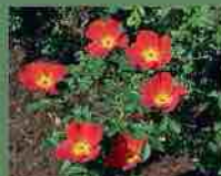
Rosa Foetida bicolor 1590