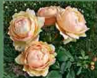
Wollerton Old Hall 2011 D. C. H. Austin