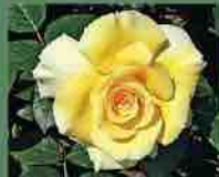
Grosvenor House 2009 A. Beales