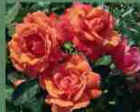
Lady Marmalade 2013 P. Harkness