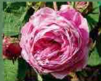
Rose des Peintres 1597