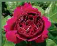
Baron Girod de l'Ain 1897 Reverchon