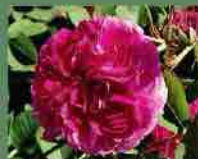
Duc de Cambridge 1840 J. Laffay