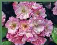
De Candolle 1590