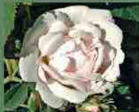
Jeanne d'Arc 1818 J. P. Vibert