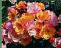
Jazz 2009 Rosen Tantau