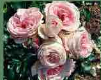
Giardina 2008 Rosen Tantau