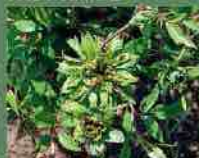
Rosa chinensis viridiflora 1827