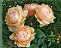
Wollerton Old Hall 2011 D. C.H. Austin