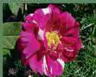
Rosa Mundi 1581