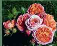
Mary Ann 2012 Rosen Tantau