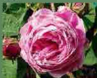
Rose des Peintres 1597