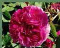
Duc de Cambridge 1840 J. Laffay