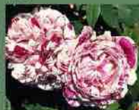
Variegata di Bologna 1909 M. Lodi