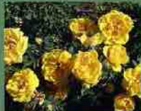
Persian Yellow 1837