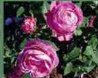
Prince Napoleon 1864 J. Perrier