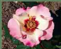
Alissar Princess of Phoenicia 2009 Harkness