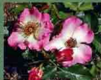
Dolomiti 2011 W. Kordes' S