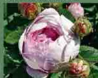
Duchesse de Montebello 1824 J. Laffay