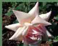
Mme Edmond Rostand 1912 J. Perrier-Ducher