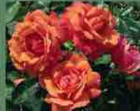
Lady Marmalade 2013 P. Harkness