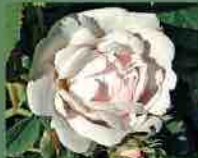
Jeanne d'Arc 1818 J. P. Mibert