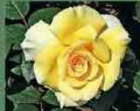
Grosvenor House 2009 A. Beales