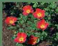
Rosa Foetida bicolor 1590