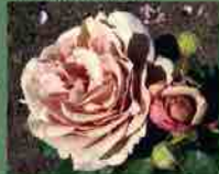
Mocarosa 2014 G. Fryer