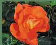
Eleanor Masson 2010 Cocker