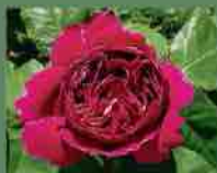
Baron Girod de l'Ain 1897 Reverchon