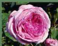
Belle sans flatterie 1920 J. F. Godefroy