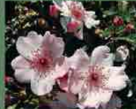
Sweet Pretty 2006 A. Meilland