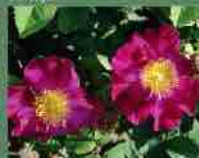
Rosa Gallica violacea 1795