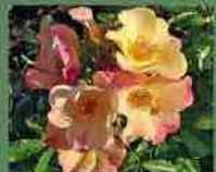
Eclat de rire 2007 F. Dorlaux