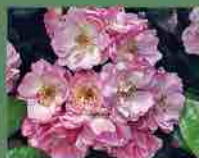
De Candolle 1590