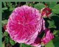
Prolifera de Redouté 1759