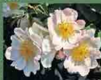
Rosa x waitziana