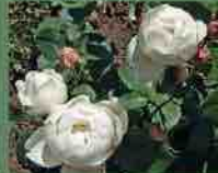
William and Catherine 2011