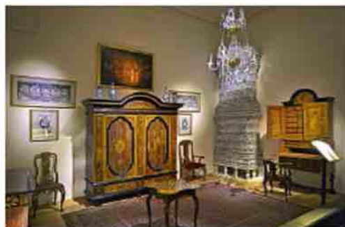
Patalpa su vėlyvojo baroko stiliaus dirbiniais (5)