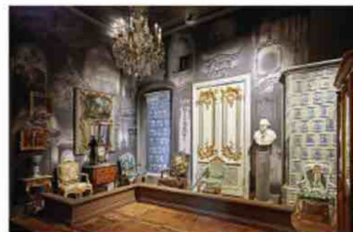
Patalpa su rokoko stiliaus dirbiniais (8)