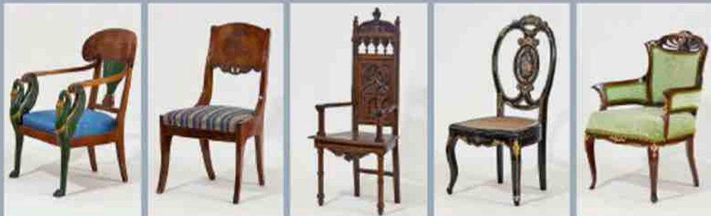
Ampyro stiliaus kėdė su gulbės motyvu atramos rankoms (12). Rusija, XIX a. pradžia