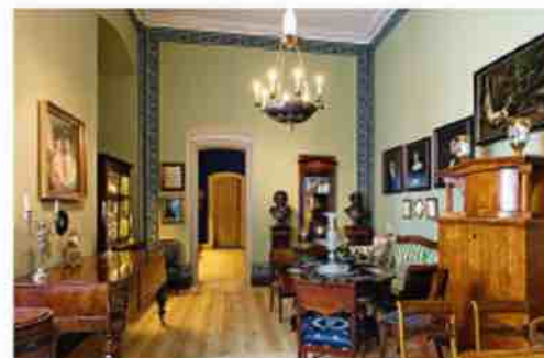
Patalpa su bydermejerio stiliaus dirbiniais (13)

iš Rundalės rūmų XVIII a. 7-ojo dešimtmečio baldų įrangos. Realistiška XVIII a. aplinka atskleidžiama patalpoje (9), kurioje įmontuotos žalios dažytos plokštės su pasidabruotais medžio drožiniais iš Puzės dvaro – vienintelis Latvijoje rokoko stiliaus patalpų sienų medinės apdailos kompleksas. Porceliano kabinetas (10) liudija apie srities „aukso amžių“ Europoje: Meiseno, Sevro, Liudvigsburgo, Berlyno ir kt. garsių manufaktūrų dirbinius papildo retybė – dvi figūrėlės iš K. Ch. Fiko ( Fick ) manufaktūros Taline. Klasicistiniai baldai, indai, dekoratyvioji bronzos ir kiti daiktai (11) sugrupuoti taip, kad leistų įvertinti stiliaus ypatumus Prancūzijoje, Anglijoje, Rusijoje, Vokietijoje, Latvijoje. Ampyrų skirtoje patalpoje (12), kurioje vyrauja graikų-rōmėnų architektūros monumentalumas ir militaristiniai ornamentų motyvai su rōščia spalvų derme, matomas laikrodinis „Diana su elniais“ – unikalus egzempliorius, 1829 m. pagamintas Rusijos industrijos parodai Sankt Peterburge. Tolėsnis interjero meno laikotarpis – bydermejerio stilius (13) – atspindi svarbiausias pilietines vertybes – gerumą, šeimyniškumą, darbštumą. XIX a. antrajai pusei būdingą ankstesniųjų stilų mėgdžiojimą, puošnumo ir išorinių efektų siekimą iliustruoja istorizmiškai skirta patalpa (14) su interjero grupėmis, perkrautomis įvairių naujųjų stilų variacijomis. Ekspozicija užbaigiama jugendo stiliaus ( Art Nouveau ) patalpa (15), kurioje yra išskirtinė prancūzų meistrų baldų ir stiklo dirbinių kolekcija.