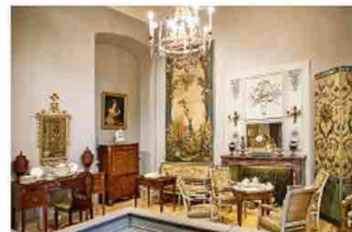
Patalpa su klasicizmo stiliaus dirbiniais (11)