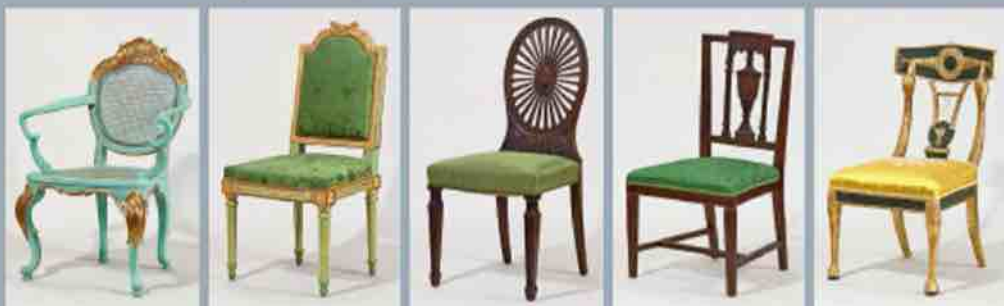
Rokoko stiliaus kėdė su paauskuoto drožinio dekoru iš hercogo Peterio Svetes rūmų Žemgaleje (8). Latvija, apie 1775 m.