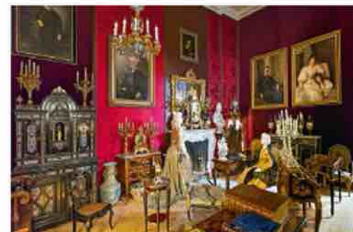
Patalpa su istorizmo stiliaus dirbiniais (14)