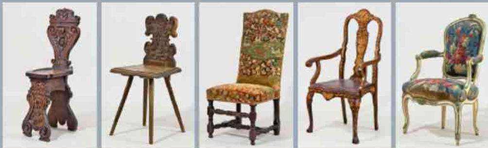
Renesanso stiliaus kėdė sgobelo (3). Italija, XVI a. vidurys

Dekoratyvinio meno ekspozicija pirmajame Rundāles rūmų aukštē – tai galimybē susipažintī su svarbiausiais istorinū stiliū ypatumais Eiropoje ir Latvijojē no XV a. iki Pirmojo pasaulinio karo