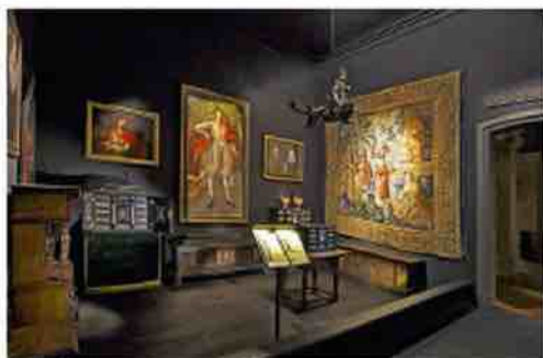
Patalpa su gotikos, renesanso ir manierizmo stiliaus dirbiniais (1)