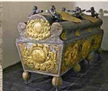
Hercogienes Sofijas Amelijas sarkofāgs

Kurzemes hercogu kapenes Jelgavas pīlī ir lielāka šāda apbedījumu vieta Latvijā, turklāt viena no nedaudzajām valdnieku dinastiju apbedījumu vietām pasaulē, kas pieejamas apskatei. Tajās apglabāti 24 Ketleru dinastijas un 6 Bironu dinastijas pārstāvji. Sakotnēji kapenes izbūvētas zem 1582. gada iesvētītas Jelgavas pils baznīcas. Pirmais tajās guldīts hercogs Gothards (†1587), tad – trīs viņa agrāk mirušie dēli, kas vispirms bija apbedīti Kuldīgas pīlī.