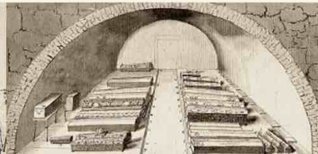
Kurzemes hercogu kapenes vecajā pīlī, 18. gs. 30. gadi