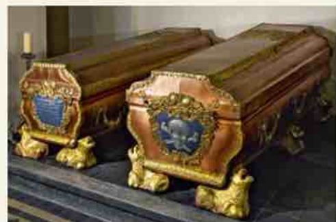
Hercoga Ernsta Johana un hercogienes Benignas Gotlibas sarkofāgi

Kurzemes hercogu kapenes Jelgavas pīlī ir lielāka šāda apbedījumu vieta Latvijā, turklāt viena no nedaudzajām valdnieku dinastiju apbedījumu vietām pasaulē, kas pieejamas apskatei. Tajās apglabāti 24 Ketleru dinastijas un 6 Bironu dinastijas pārstāvji. Sakotnēji kapenes izbūvētas zem 1582. gada iesvētītas Jelgavas pils baznīcas. Pirmais tajās guldīts hercogs Gothards (†1587), tad – trīs viņa agrāk mirušie dēli, kas vispirms bija apbedīti Kuldīgas pīlī.