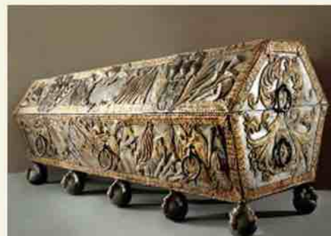
Hercoga Jēkaba sarkofāgs

Kapenēs atrodas 21 metāla sarkofāgs un 9 koka zārki. Senākais ir pirmā Kurzemes hercoga Gotharda dēla Sigismunda Alberta (†1569) alvas sarkofāgs. Hercoga Gotharda sarkofāgs ir vienkāršs, mazrotājums ir arī viņa sievas Annas (†1602) un hercoga Vilhelma sievas Sofijas (†1610) sarkofāgiem, taču tos klāj gravēti ģerboņi un uzraksti. Greznākie alvas sarkofāgi ar reljefiem manierisma stila ornamentiem ir hercogienei Elizabetei Magdalēnai (†1649; sarko-