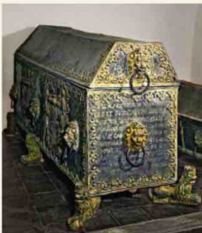
Hercoga Vilhelma sarkofāgs

Kopš 1987. gada Kurzemes hercogu kapenes ir Rundāles pils muzeja pārziņā, 1990. gadā tās atvērta apskatei. Apzinoties kapeņu vēsturisko un māksliniecisko vērtību, iekārtots muzejs, kura uzdevums ir objekta vispusīga saglabāšana un uzturēšana, rēķinoties ar dabisko iznīcības gaitu. Nesagraujot šīs miera vietas jēgu, notiek zārku, sarkofāgu, tekstiliju konservācija un restaurācija, mirstīgo atlieku sakārtošana un saglabāšana.