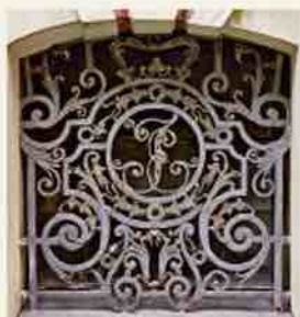
Dekoratīvas dzelzs kaluma logu restes ar hercoga Ernsta Johana monogrammu

Gadsimtu gaitā hercogu apbedījumi vairākkārt nežēlīgi postīti un izlaupti. 1705. gadā sarkofāgus izlaupija zviedru kareivji, 1919. gadā kapenes demoleja gan boļševiku, gan Bermonta-Avalova armijas zaldāti. Latvijas brīvvalsts laikā tika veikta sarkofāgu restaurācija, kapeņu remonts un paplašināšana, un 1935. gadā tās atvērta apskatei. Pēc Otrā pasaules kara kapenes ilgstoši postīja un apgānīja.