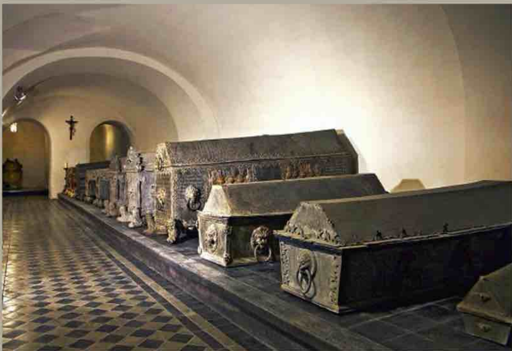
Kurzemes hercoga kapenes, 2010. gada foto