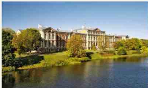
Jelgavas pils, skats no tilta