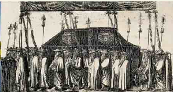
Kurzemes hercogienes Lutzes Šarlotes bērū gājiens