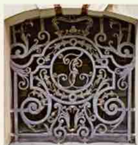
Решетка окна усыпальницы с монограммой герцога Эрнста Иоганна

В 1705 году герцогская усыпальница Елгавского дворца была разграблена солдатами шведской