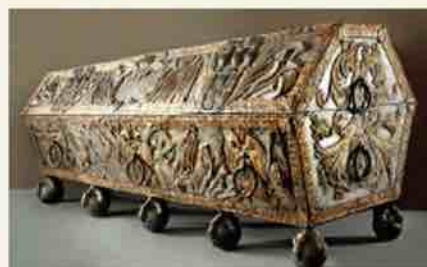
Саркофаг герцога Якоба