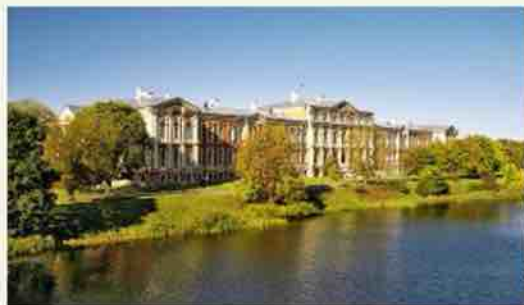
Елгавский дворец, вид со стороны моста