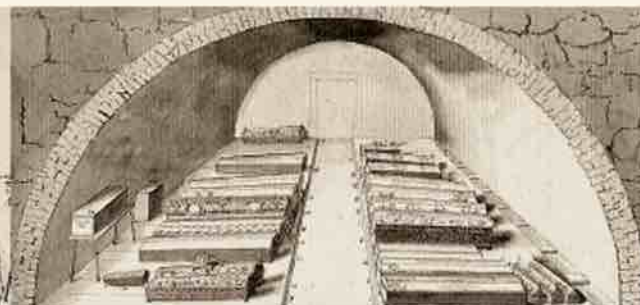
Усыпальница курляндских герцогов в старом дворце. 30-е гг. XVIII в.