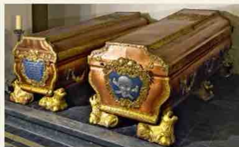
Саркофаги герцога Эрнста Иоганна и герцогини Бенигны Готтлиб

армии, а в 1919 году пережила погромы, устроенные коммунистами и солдатами армии Бермонта-Авалова. В 1934–1935 годах саркофаги были отреставрированы, усыпальница была расширена и открыта для осмотра.