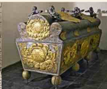
Саркофаг герцогини Софии Амелии

Усыпальница курляндских герцогов в Елгавском дворце является самым большим местом захоронения подобного типа в Латвии и одним из немногих открытых для посещения мест захоронения правящих династий в мире. В усыпальнице похоронено 24 представителя династии Кетлеров и 6 представителей династии Биронов. Первоначальное местонахождение усыпальницы было под освященной в 1582 году церковью Елгавского дворца. Первым там был захоронен герцог Готхард (+1587), останки его ранее умерших сыновей были перевезены в Елгаву из Кудлиги.