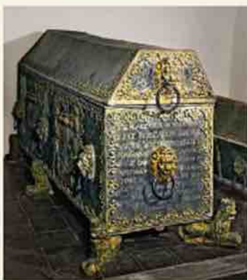
Саркофаг герцога Вильгельма

Усыпальница курляндских герцогов в Елгавском дворце является самым большим местом захоронения подобного типа в Латвии и одним из немногих открытых для посещения мест захоронения правящих династий в мире. В усыпальнице похоронено 24 представителя династии Кетлеров и 6 представителей династии Биронов. Первоначальное местонахождение усыпальницы было под освященной в 1582 году церковью Елгавского дворца. Первым там был захоронен герцог Готхард (+1587), останки его ранее умерших сыновей были перевезены в Елгаву из Кудлиги.