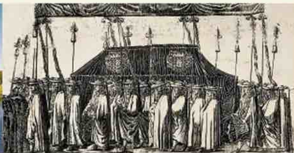
Процессия похорон курляндской герцогини Луизы Шарлотты