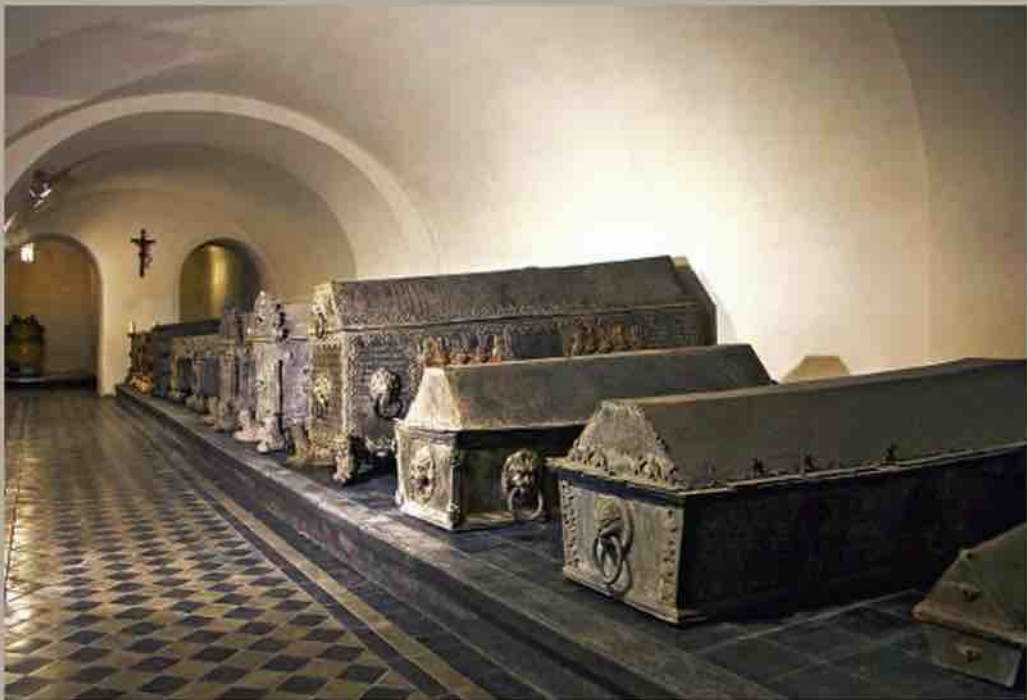
Усыпальница курляндских герцогов. Фото 2010