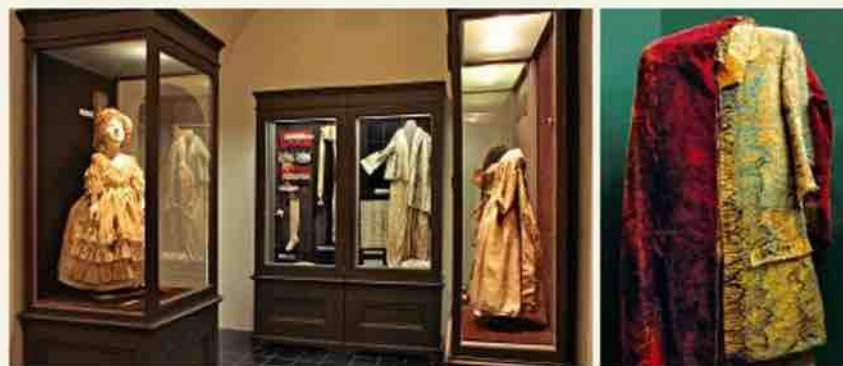
Фрагменты жилета и мантии герцога Фридриха Казимира