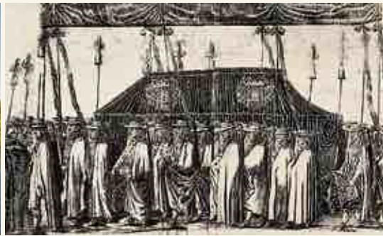
Процессия похорон курляндской герцогини Луизы Шарлотты