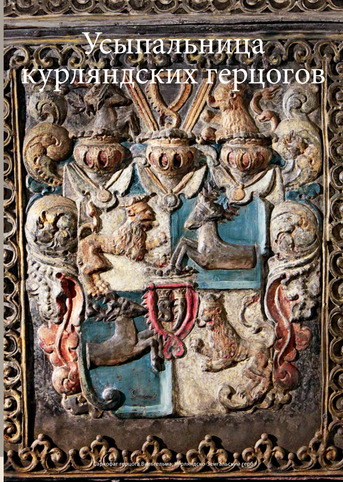
Саркофаг герцога Вильгельма, Курляндско-Земгальский герб