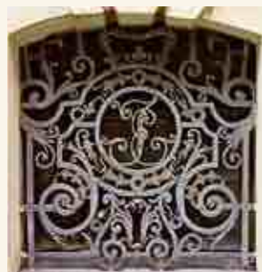
Решетка окна усыпальницы с монограммой герцога Эрнста Иоганна

В 1705 году герцогская усыпальница Елгавского дворца была разграблена солдатами шведской армии, а в 1919 году пережила погромы, устроенные коммунистами и солдатами армии Бермонта-Авалова. В 1934–1935 годах саркофаги были отреставрированы, усыпальница была расширена и открыта для осмотра.