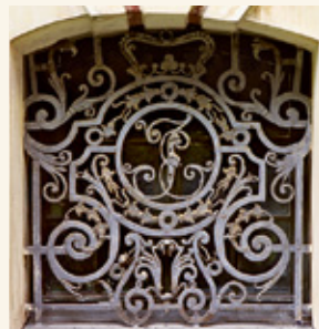
Решетка окна усыпальницы с монограммой герцога Эрнста Иоганна

В 1705 году герцогская усыпальница Елгавского дворца была разграблена солдатами шведской армии, а в 1919 году пережила погромы, устроенные коммунистами и солдатами армии Бермонта-Авалова. В 1934–1935 годах саркофаги были отреставрированы, усыпальница была расширена и открыта для осмотра.