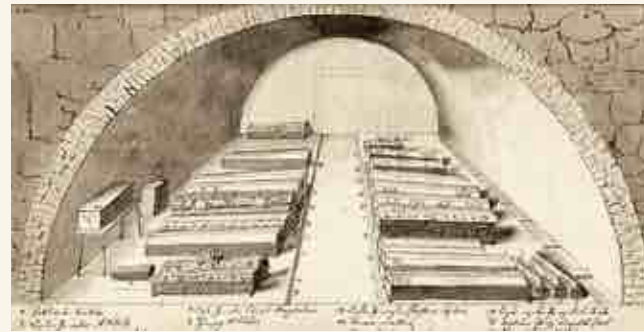
Усыпальница курляндских герцогов в старом дворце. 30-е гг. XVIII в.