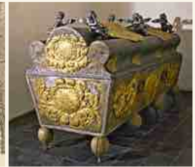
Саркофаг герцогини Софии Амелии

В усыпальнице курляндских герцогов Елгавского дворца покоятся останки 24 представителей династии Кетлеров и шести представителей династии Биронов. Первые сыновья герцога Готхарда Сигизмунд Альберт, Георг и Готхард были захоронены в гробнице Кулдигского замка и только позднее перевезены в новую усыпальницу курляндских герцогов, построенную под освященной в 1582 году церковью Елгавского дворца. Первым здесь был захоронен скончавшийся в 1587 году герцог Готхард.