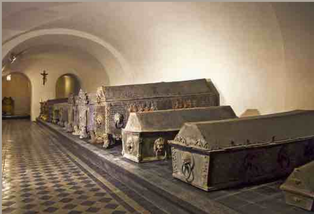
Усыпальница курляндских герцогов. Фото 2010