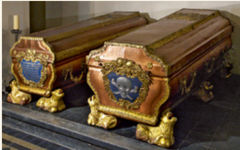
Саркофаги герцога Эрнста Иоганна и герцогини Бенигны Готтлиб

В усыпальнице курляндских герцогов находятся 21 саркофаг из металла и девять деревянных гробов. Самый ранний оловянный саркофаг принадлежит