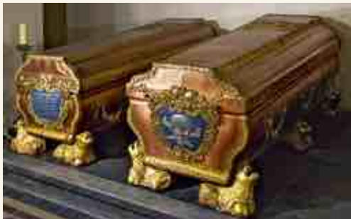
Саркофаги герцога Эрнста Иоганна и герцогини Бенигны Готтлиб

В усыпальнице курляндских герцогов находятся 21 саркофаг из металла и девять деревянных гробов. Самый ранний оловянный саркофаг принадлежит