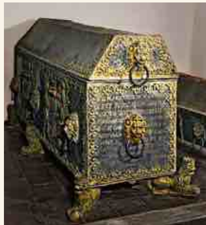
Саркофаг герцога Вильгельма

В 1737 году старая герцогская резиденция вместе с церковью были разобраны, чтобы освободить место для строительства спроектированного Ф. Б. Растрелли нового дворца. Герцогские останки были вывезены на временное хранение, а в 1740 году перенесены в два помещения цокольного этажа нового дворца.