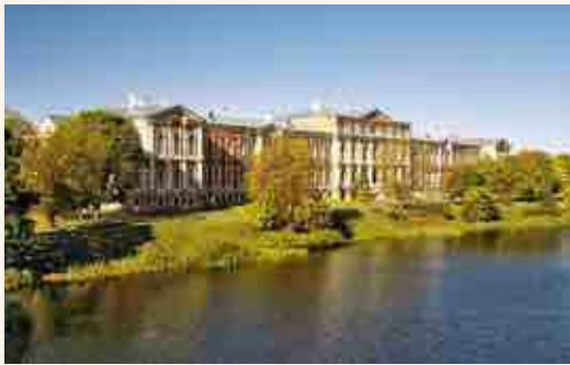
Елгавский дворец, вид со стороны моста